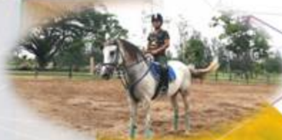
อาชาบำบัด