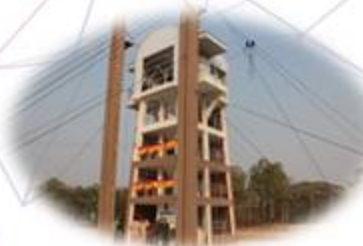
กระโดดหอ